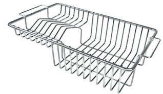
Panier à vaisselle inox 8100 201

* uniquement en combinaison avec l'accessoire 8644 101