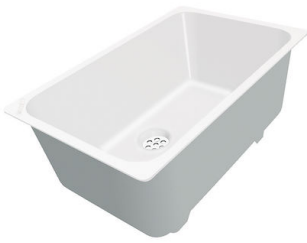
Cuvette blanche 8153 100