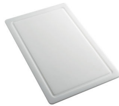
Planche de découpe en HPDE 8657 001