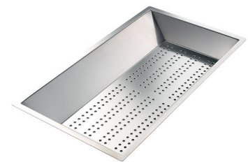
Cuvette perforée en acier inoxydable 8151 000

* uniquement en combinaison avec l'accessoire 8644 101