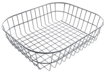
Panier en acier inoxydable 8611 000